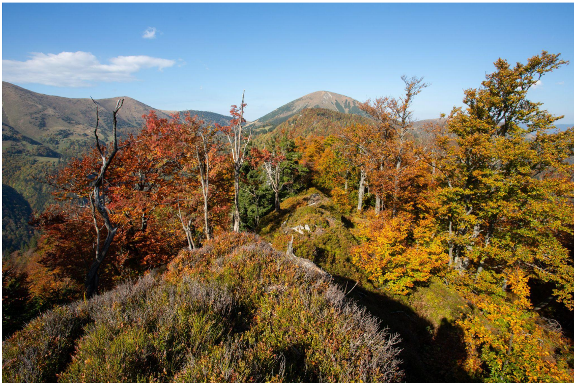
Obr. 1 Dobře spravované chránené územia sú veľkou príležitosťou pre našu krajinu, špeciálne pre vidiecke oblasti.