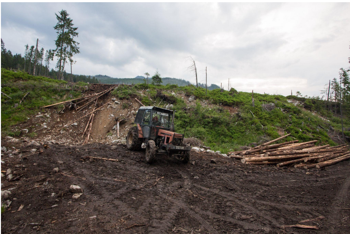
Obr. 4 Traktor v národnom parku a zároveň v rezervácii (rok 2018). Takýto prístup k našim chráneným územiám sa už nesmie opakovať.