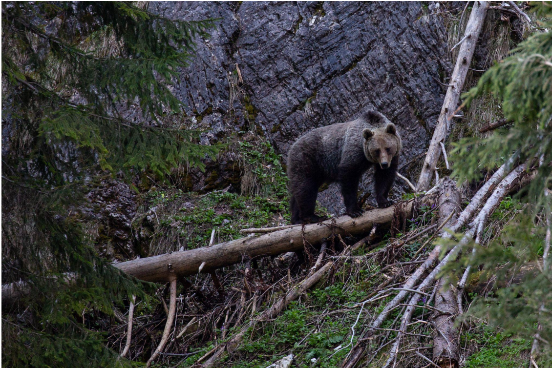
Obr. 3 Zneužívanie témy medveďa je neprípustné. Namiesto toho treba aplikovať už osvedčené preventívne opatrenia